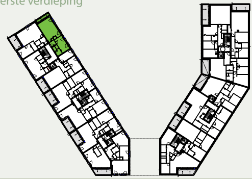
Premier étage Eerste verdieping

Plan non contractuel donné à titre indicatif. Des modifications sont susceptibles d'être apportées par le maître de l'ouvrage en fonction des nécessités techniques. Se référer au descriptif de vente pour le détail des fournitures.