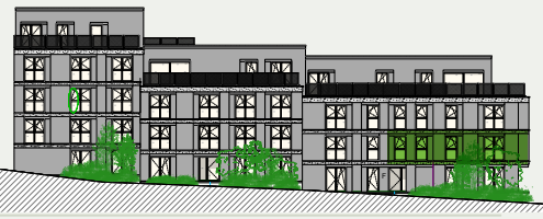
Façade (NE) Gevel